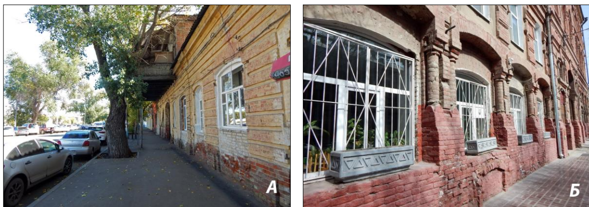
Рис. 2. Характерные места обитания T. caspius в г. Астрахань: А – старинные жилые здания по набережной р. Кутум; Б – кирпичное здание с обширными подвальными помещениями по ул. Советской Милиции

большого по площади асфальтированного двора. Убежище данного геккона находилось под бетонной плитой канализационного коллектора.