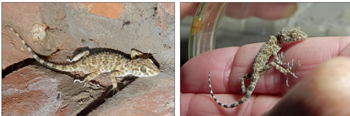
Рис. 3. Взрослый экземпляр каспийского геккона ( Tenuidactylus caspius ) на стене здания в городе Астрахань